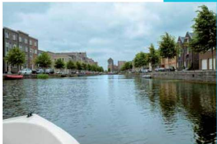
Markenhaven De laak

Vlak buiten Amersfoort ligt één de oudste polders van Nederland, de polder Arkemheen. Het is een groene oase tussen de stedelijke bebouwing van Amersfoort, het Gooi en de rest van de Randstad. Veel water- en weidevogels broeden en/of overwinteren er, of trekken door het gebied. U kunt er ontspannen doorheen fietsen, maar er mag ook (elektrisch) gevaren worden. Meer info: www.arkemheen-eemland.nl .